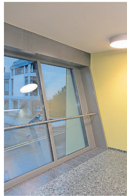
Empfang 1. Obergeschoss.