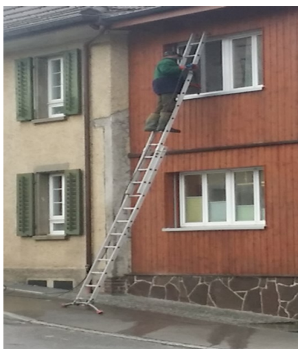
Arbeit mit Leiter an Fassade

ner gepflegten Hauswartung mit ihren Dienstleistungen zu erfüllen. Dazu gewährleistet sie mit griffigen Pflichtenheften die optimale Bewirtschaftung aller Liegenschaften, dabei geht jedoch die Sicherheit der Hauswarte immer vor.