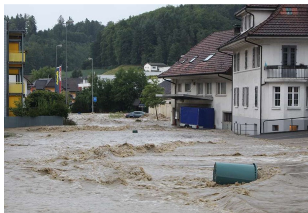
Überschwemmte Strasse in Uerkheim