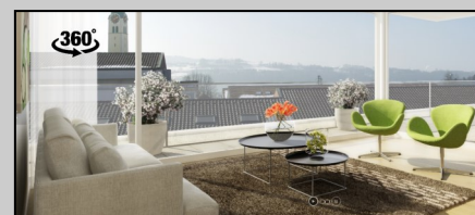
360° View Bärenmatte Seengen

Unsere Vermietungsspezialisten kennen die Realitäten der derzeitigen Marktlage und die Instrumente für eine vermietungsfördernde Wieder- sowie Erstvermietung. Im 2017 haben wir bisher rund 400 Mietverträge abgeschlossen.