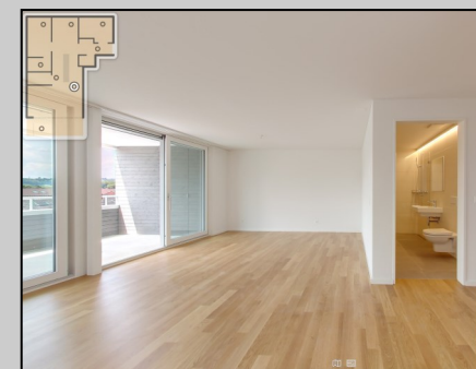
Digitaler Wohnungsrundgang ( www.baeren-seengen.ch )