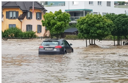
Hochwasser in Bottenwil

beitet werden. Insgesamt wurden 2'000 Einsatzstunden geleistet und Aufträge für CHF 1 Mio. vergeben.