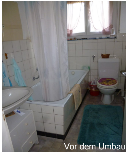
Vor dem Umbau

Sind Sie im Besitz einer Liegenschaft mit Sanierungspotenzial? Wenn ja, sollten Sie unsere Spe-