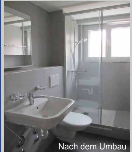
Nach dem Umbau

zialisten mit dem nötigen Fachwissen beiziehen. Mit unserer langjährigen Erfahrung stehen wir Ihnen gerne mit Rat und Tat zur Seite. Im Vorfeld einer Planung empfehlen wir dem Hauseigentümer, die Liegenschaft einer genauen Untersuchung zu unterziehen. Der Gebäudecheck liefert kompetente Aussagen über den technischen Zustand der Liegenschaft, inklusive der approximativen Kostenschätzung für wertvermehrnde Investitionen unter Berücksichtigung der steuerlichen Aspekte. Die Gebäudeanalyse bildet ein ausgezeichnetes Instrument für die richtige Wahl der Erneuerungsstrategie und für die marktgerechte Festlegung der neuen Nettomietzinsen nach der Sanierung.