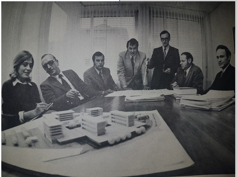
1973, bei einer interdisziplinären Bauprojekt-Sitzung