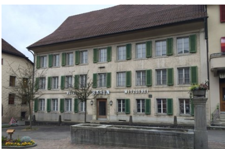
Das Gasthaus Bären vor dem Umbau

Von heute auf morgen kann die bisherige Nutzung eines Grundstücks unwirtschaftlich werden und muss deshalb geändert oder gar aufgegeben werden. Entweder sind grössere Investitionen erforderlich oder es ist sogar eine grundsätzliche Neubeurteilung der gegebenen Marktchancen im Immobilienmarkt nötig. Vor allem bereits lang bestehende Restaurantbetriebe sind einem starken Konkurrenzdruck ausgesetzt, der sich oft in einem häufigen Wechsel der Wirte und des Küchenangebots zeigt. Weiter sind die bestehenden Betriebe durch die Entwicklung hin zur System- und der Erlebnisastronomie sowie dem verstärkten Aufkommen von Themenrestaurants herausgefordert. Den Folgen dieser Veränderungen haben sich auch traditionelle Dorfgaststätten zu stellen. Im Jahr 2010 hat eine Firma der Realitgruppe das Bärenareal mit ei-