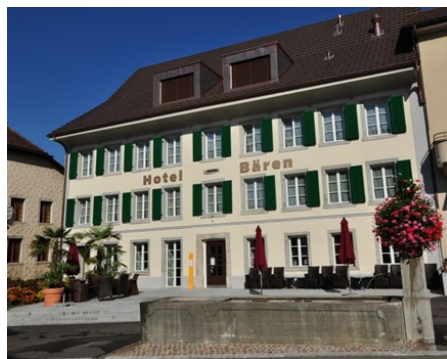
Das Hotel Bären nach dem Umbau

Damit eine bestehende Baute optimiert oder umgenutzt werden kann, wird in der Bauwirtschaft, vor allem von öffentlichen Bauträgern, häufig ein strukturiertes Verfahren angewendet. In diesem Fall war sicherzustellen, dass der Ersatzbau einer für das Ortsbild gleichwertigen Lösung entsprach. Um dieses Resultat zu erreichen, führte die Realit Bautreuhand AG einen Studienauftrag mit anschliessender Jurierung durch. Dazu waren vier regionale Architekturbüros eingeladen, die ihre Ideen präsentieren konnten. Das Siegerprojekt sah eine Erweiterung des bestehenden Gasthofes mit einem Gelenk- und einem zusätzlichen Hotelannexbau vor. Eine vertiefte Prüfung dieses Projektes ergab aber, dass keine genügende Rendite zu erwirtschaften war. Der geplante Hotel- und Restaurantkomplex war zu gross angelegt, so dass der Markt die angebotene Menge an Hotelzimmern und Restaurantplätzen voraussichtlich nicht aufnehmen konnte. Zudem wurde für den angrenzenden Neubau für das Erdgeschoss kein geeigneter Nutzer gefunden.