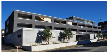
Das neue Mehrfamilienhaus Bärenmatte

Somit war die Projektleitung erneut gefordert, einen realitätsnahen und realisierbaren Vorschlag zu erarbeiten. Die Parzelle mit dem Gasthof wurde verkauft, so dass zwei unabhängige Bauvorhaben entstanden. Für den Hotelteil erstellte ein in der Region ansässiges Architekturbüro ein Vorprojekt. Dieses enthielt u.a. die Festlegung des Projekts, die Grundriss- und Fassadengestaltung, eine Kostenschätzung und ein Grobterminprogramm. Unter der Bauleitung der Realit Bautreuhand AG wurde der Restaurantbau bis auf die Süd- und Westmauern abgebrochen und zwischen August 2016 und Dezember 2017 ein Neubau erstellt. Im Erdgeschoss entstanden eine Lounge mit breitem Sortiment an Wein, Whisky und Zigarren und im 1.-3. Obergeschoss 20 moderne Hotelzimmer und 4 Apartments. Die Zimmer sind online buchbar, wobei das Hotel ohne Rezeption auskommt. Die Eröffnung fand am 23. April 2018 statt. Auf der nördlichen Parzelle entstand zwischen Frühling 2016 und Sommer 2017 das Mehrfamilienhaus Bärenmatte, ein Neubau mit 18 2,5 bis 4,5 Zimmerwohnungen sowie 3,5 bis 4,5 Zimmer-Attikawohnungen, einer Parkgarage im Erd- und Mieterkellern im Untergeschoss.