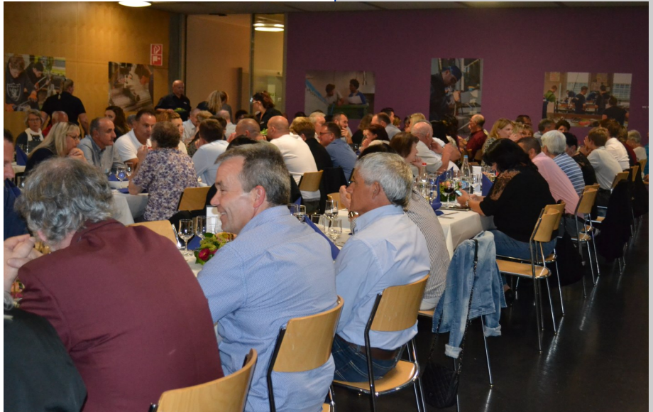
Nachtessen in der Mensa der Berufsschule

In der Mensa der Berufsschule Lenzburg servierte das Team des timeout Restaurants anschliessend das Nachtessen. Als besondere Attraktion wurde erstmals der Hauswart des Jahres